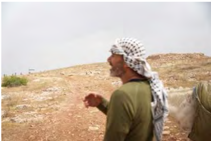
← © Un berger palestinien de Makhoul devant des pâturages situés près de son village. Un bâtiment construit illégalement par des colons israéliens apparaît en arrière-plan. © Amnesty International

Les communautés palestiniennes menacées sont plus que conscientes du sort qui risque d'être le leur. Ein al Hilweh, un petit village de bergers qui compte une cinquantaine de personnes, est confronté à l'escalade de la violence des colons depuis fin 2023, à des arrestations et des manœuvres d'intimidation de la part des forces israéliennes et au développement des avant-postes et colonies voisins, qui s'accompagne de la construction de clôtures restreignant leur liberté de circulation. En juillet et août 2025, les forces israéliennes ont démolé tous les bâtiments collectifs, laissant de fait les membres de la communauté sans abri.