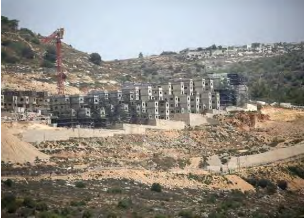
☺ ↑ Vue générale des nouveaux bâtiments de la colonie juive d'Eli, au sud de Naplouse (Cisjordanie). En mai 2025, le gouvernement israélien a approuvé une expansion de grande ampleur des colonies juives et a repris l'enregistrement de terres dans la zone C de la Cisjordanie occupée, accélérant le processus d'annexion. 19 mai 2025

À l'inverse, la politique consolidée d'Israël visant à restreindre les constructions et les travaux d'urbanisme palestiniens en Cisjordanie, et en particulier dans la zone C, s'est intensifiée : en 2023 et 2024, aucun projet d'habitation palestinien n'a été approuvé dans la zone C et des permis n'ont été accordés qu'à neuf logements.